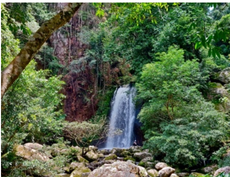
Illustration de la couverture :

Xavier Gouverneur & Philippe Guérard . . . . . 1 – 3